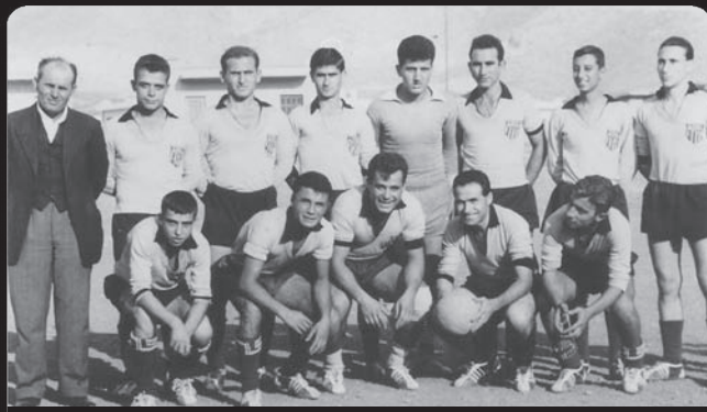
1960-61. Η Ποδοσφαιρική ομάδα λίγο πριν μπει στην Εθνική κατηγορία...