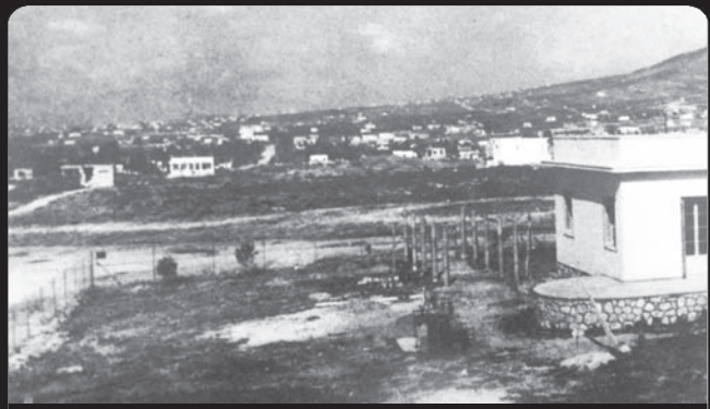
Σημερινή οδός, Μικράς Ασίας. Στο βάθος αριστερά φαίνεται για λίγο το οικόπεδο που δημιουργήθηκε το πρώτο γήπεδο της Αργυρούπολης (εχχιδέζικο).

Η Αργυρούπολη, πρωάστιο της Αττικής με 50.000 κατοίκους σήμερα, είναι χτισμένη στις υπώρειες του Υμηττού στη θέση του αρχαίου δήμου Ευωνύμου. Οι ρίζες της ανάχονται στην ομώνυμη πόλη του ορείνου γόντου, στα φέρεια της Μικράς Ασίας, που είναι πόλη ηρώσια σε μεταλλεύματα, με κυρίαρχο τον άργυρο.