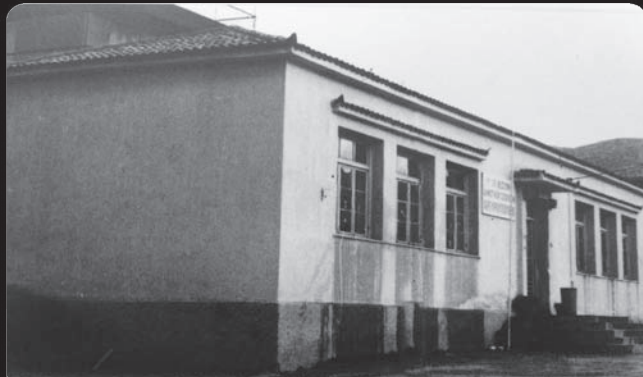
Το Α' Δημοτικό σχολείο Αργυρούπολης. Σε αυτό το κτίριο τη Σεκαέρτα του '60 γίνονταν Γενικές Συνελεύσεις της ομάδας...