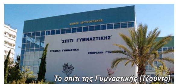
Το σπίτι της Γυμναστικής (Τζούντο)