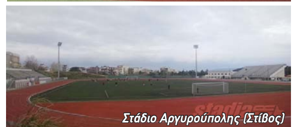
Στάδιο Αργυρούπολης (Στίβος)