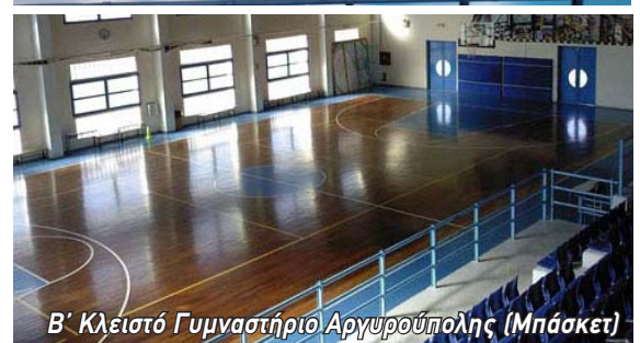
Β' Κλειστό Γυμναστήριο Αργυρούπολης (Μπάσκετ)