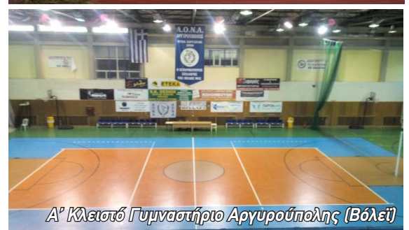
Α' Κλειστό Γυμναστήριο Αργυρούπολης (Βόλεϊ)